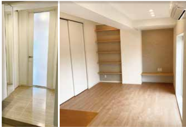
●現地写真(令和4年6月11日撮影)